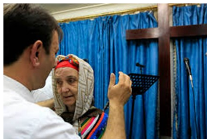
Doop van een wedergeboren vrouw