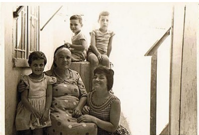
Iraakse joden in Israel

Neem voor informatie contact op met Sifra: sifraessid@gmail.com