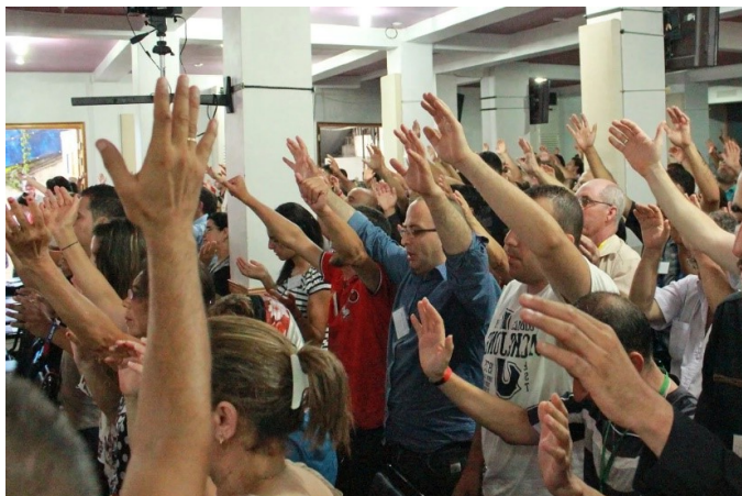
Algerije: gelovige in Jesjoea zijn is een dagelijkse strijd