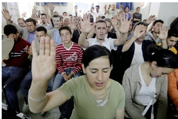
Bid voor de jonge generatie